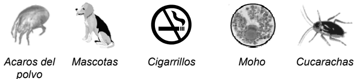
Acaros del polvo